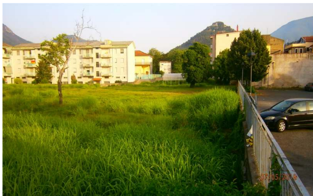
Foto n°7 : Vista area esterna oggetto d'intervento per l'installazione della serra