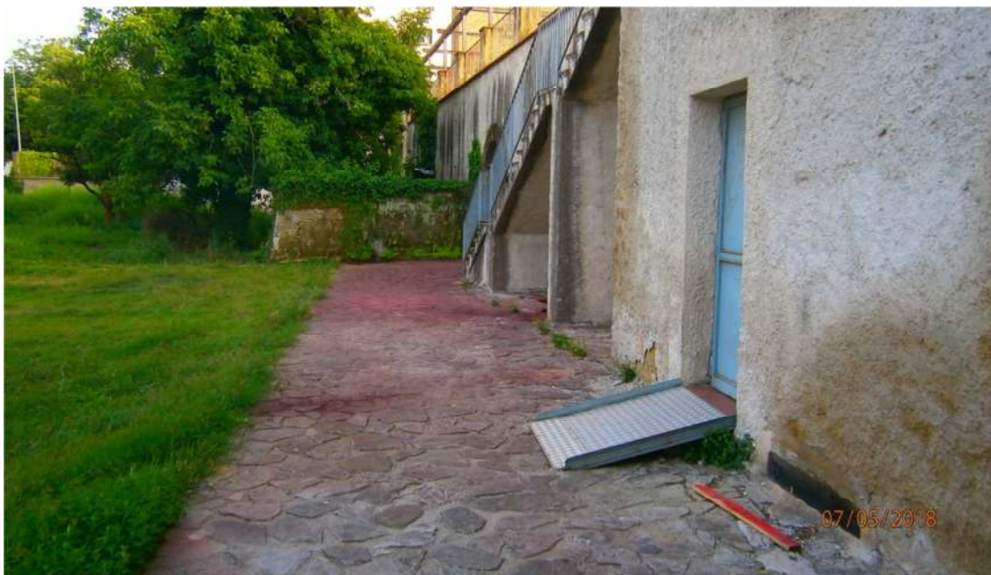
Foto n°8 : Particolare uscita "Palazzo Marciani" per collegamento con area esterna