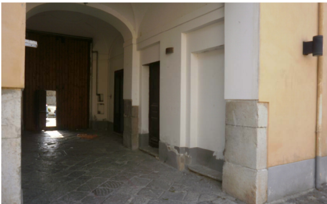
Foto n°1 : Ingresso principale "Palazzo Marciani" con vista ingresso locali laboratori